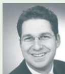
Oliver Schwendinger Soltain GmbH